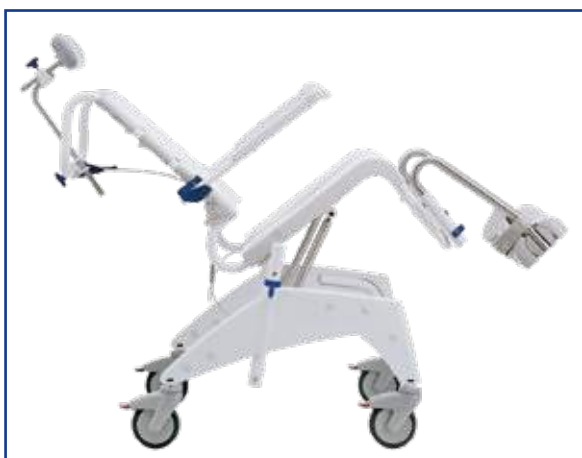
Basculamento da 0° a 35°