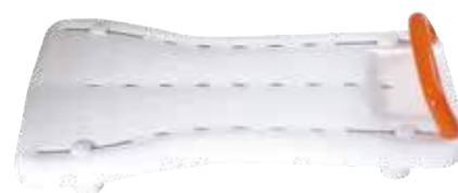
Tavola da vasca realizzata in Polipropilene con sistema di fissaggio interno regolabile, garantisce un appoggio perfetto dell'utente a bordo vasca e maggior comfort per la cura dell'igiene intima.