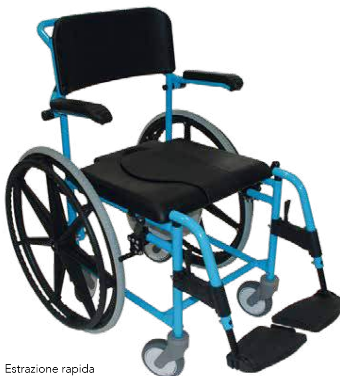
Estrazione rapida ruote posteriori