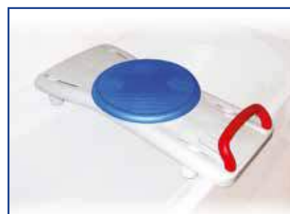
Tavola da vasca realizzata in Polipropilene con sistema di fissaggio interno regolabile. Il movimento per l'entrata nella vasca da bagno è facilitato grazie al piano di appoggio girevole. Garantisce un appoggio perfetto dell'utente a bordo vasca e maggior comfort per la cura dell'igiene intima.